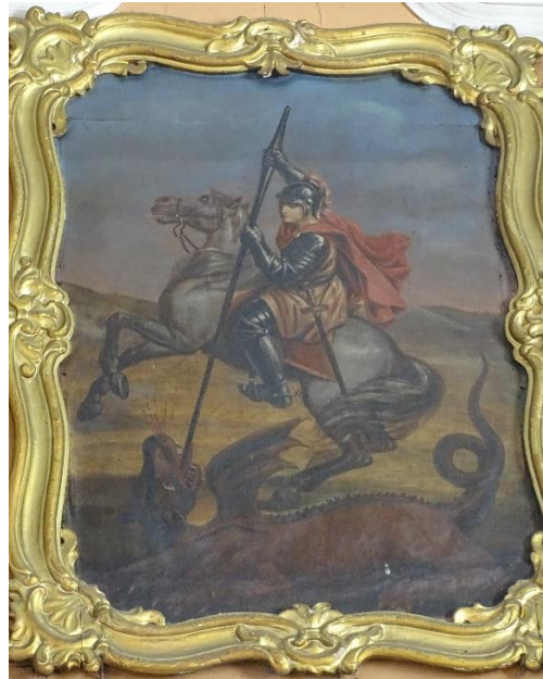
24. pav. Paveikslas „Šv. Jurgis“, fot. E. Bagušinskaitė, 2024 m.