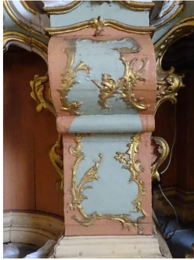
4. pav. Senosios mensos dekoru fragmentas