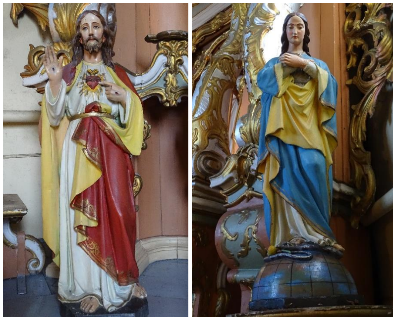
21. pav. Skulptūra „Švč. Jėzaus Širdis“, fot. E. Bagušinskaitė, 2024 m.