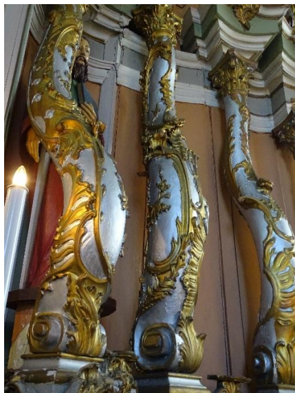
8. pav. Didžiojo altoriaus vidurinės dalies, dešinės pusės kolonos, fot. E. Bagušinskaitė, 2024 m.

Kiti autoriai teigia, jog skirtingi kolonų išsilankstymai turi kompozicinę prasmę, nes jos remia antablementinius anstatus, įvairiais atstumais įtrauktus į gilumą 51 . Kolonų nešamas antablementas yra vieno lygio visiems altoriams. Jis labai smarkiai plėšytas – tiek, kad susidaro įspūdis, jog kiekviena kolona neša po visai atskirą antablemento fragmentą 52 .