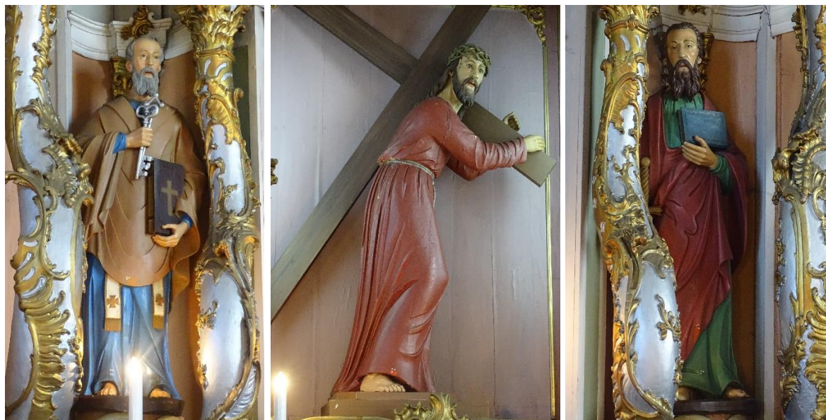
16. pav. Skulptūra „Šv. apaštalas Petras“, fot. E. Bagušinskaitė, 2024 m.

Po altoriaus rekonstrukcijos, 1884 m. inventoriuje 53 minima, jog didžiajame – 3 naujos figūros, padirbintos skulptoriaus Zimodro , būtent – šv. apaštalų Petro ir Pauliaus bei Jėzaus, nešančio kryžių. Tai retai pasitaikantis atvejis, kuomet įvardintas skulptūras išdrožęs autorius. Pastarasis yra žinomas Vilniaus skulptorius Abdonas Zimodra, ilgametis skulptorių ir auksintojo cecho meistras, dirbęs apie 1861–1891 m. Be to, skobtose apaštalų skulptūrų nugarose yra ir autoriaus signatūra su data. Įrašas juodu dažu šv. apaštalo Pauliaus nugarinėje pusėje: „w. Wilnie / Skulptor / Zimodro / 1875 ro / 25 Maja“. Medinės, pirminę polichromiją išsaugojusios skulptūros, darniai įsikomponuoja į didįjį altorių.