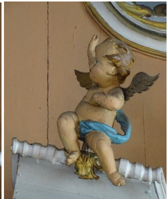
12, 13. pav. Angeliukų skulptūrų pora I, fot. E. Bagušinskaitė, 2024 m.