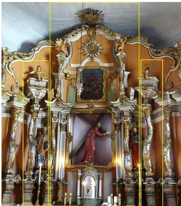
2. pav. Smilgių bažnyčios didžiojo altoriaus centrinė dalis, fot. E. Bagušinskaitė, 2024 m.

Atkreiptinas dėmesys ir į nevienodą kolonų pjedestalų dekorą, rodantį, jog jie galėjo būti sukurti skirtingu metu. Vieni konsolės formos pjedestalai dekoruoti itin smulkiais drožiniais, kiti – grubesni, plokštesnių formų. (3 pav.)