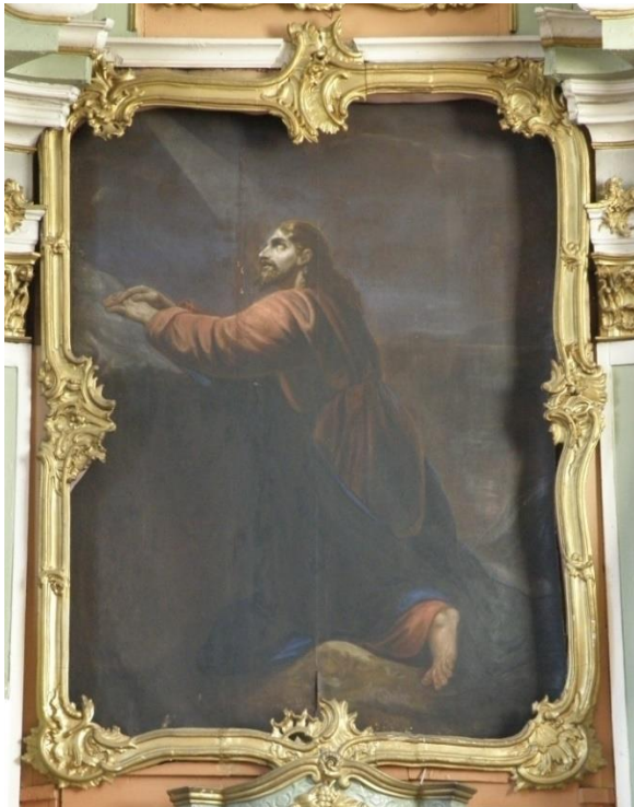
23. pav. Paveikslas „Jėzus Alyvų kalne“ 2018 m.

Paveikslai altoriui pritaikyti po rekonstrukcijos – 1884 m. inventoriuje 56 minini nauji devyni paveikslai esantys altoriuose. Nors paveikslai nebuvo įvardinti, tačiau tapysena, pasirinkti ikonografiniai siužetai rodo, jog tai XIX a. pab. kūriniai.