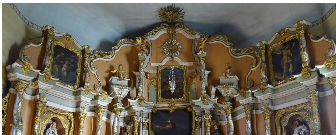
9. pav. Didžiojo altoriaus frontonas su antablementu, fot. E. Bagušinskaitė, 2024 m.

Kiti autoriai teigia, jog skirtingi kolonų išsilankstymai turi kompozicinę prasmę, nes jos remia antablementinius anstatus, įvairiais atstumais įtrauktus į gilumą 51 . Kolonų nešamas antablementas yra vieno lygio visiems altoriams. Jis labai smarkiai plėšytas – tiek, kad susidaro įspūdis, jog kiekviena kolona neša po visai atskirą antablemento fragmentą 52 .