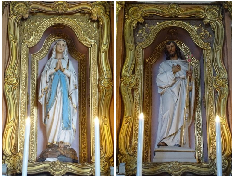
19. pav. Skulptūra „Lurdo Švč. Mergelė Marija“, 2024 m.

Jėzus neša kryžių; 4) Šv. Juozapas; 5) Šv. Petras; 6) Šv. Povilas; 7) Nekaltojo Prasidėjimo Švč. Mergelė Marija; 8) Šventoriuje – Jėzaus Širdies.