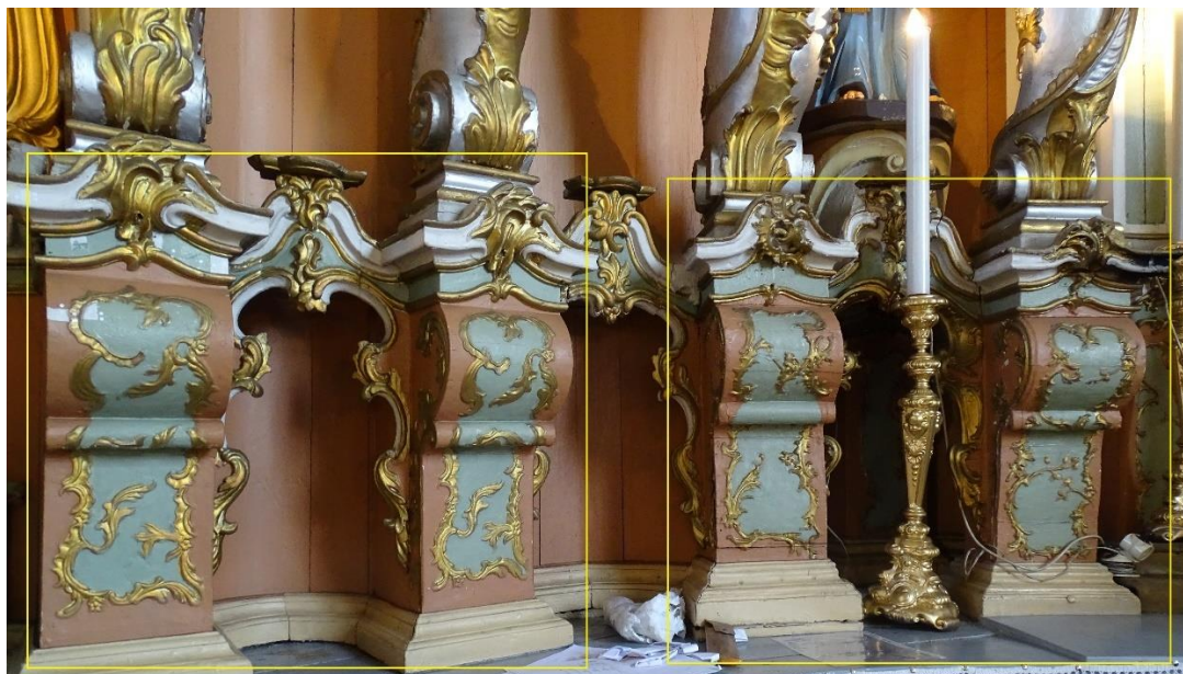
3. pav. Didžiojo altoriaus kolonų pjedestalų dekoras, fot. E. Bagušinskaitė, 2024 m.

Atkreiptinas dėmesys ir į nevienodą kolonų pjedestalų dekorą, rodantį, jog jie galėjo būti sukurti skirtingu metu. Vieni konsolės formos pjedestalai dekoruoti itin smulkiais drožiniais, kiti – grubesni, plokštesnių formų. (3 pav.)