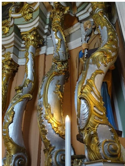
7. pav. Didžiojo altoriaus vidurinės dalies, kairės pusės kolonos, 2024 m.

buvo žinoma ir Smilgiuose dirbusiam meistrui. Taigi, Lietuvą labai greitai bus pasiekęs naujas, kad ir plačiau nepaplitęs, architektūrinės atramos tipas“ 50 .