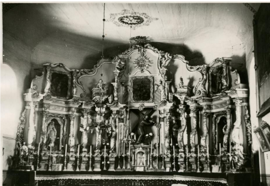
1. pav. Smilgių bažnyčios didysis altorius , fot. J. Gramba, 1967 m., Kultūros paveldo tyrimų valdybos, Kilnojimų objektų skyriaus archyvas.

naujos figūros, padirbintos skulptoriaus Zimodro , būtent – šv. apaštalų Petro ir Pauliaus bei Jėzaus, nešančio kryžių. 1888 m. vizitacijoje 46 taip pat minimi 7 altoriai, 5 iš jų paauksuoti . Altoriuose 9 paveikslai, o didžiajame šv. apaštalų Petro ir Pauliaus bei Jėzaus, nešančio kryžių, skulptūros. Toks pats vaizdas ir 1890 m. inventoriuje 47 . 1899 m. 48 minima, jog bažnyčioje iš viso septyni altoriai, trys iš jų – sudaro didįjį altorių , su trimis gero skulptoriaus darbo figūromis – šv. apaštalų Petro ir Pauliaus bei Jėzaus, nešančio kryžių. Devyni paveikslai visuose altoriuose geros tapybos. Taigi, po XIX a. 8 deš. rekonstrukcijos darbų, didysis altorius tapo tokiau, kokį matome ir šiandien. (1 pav.)